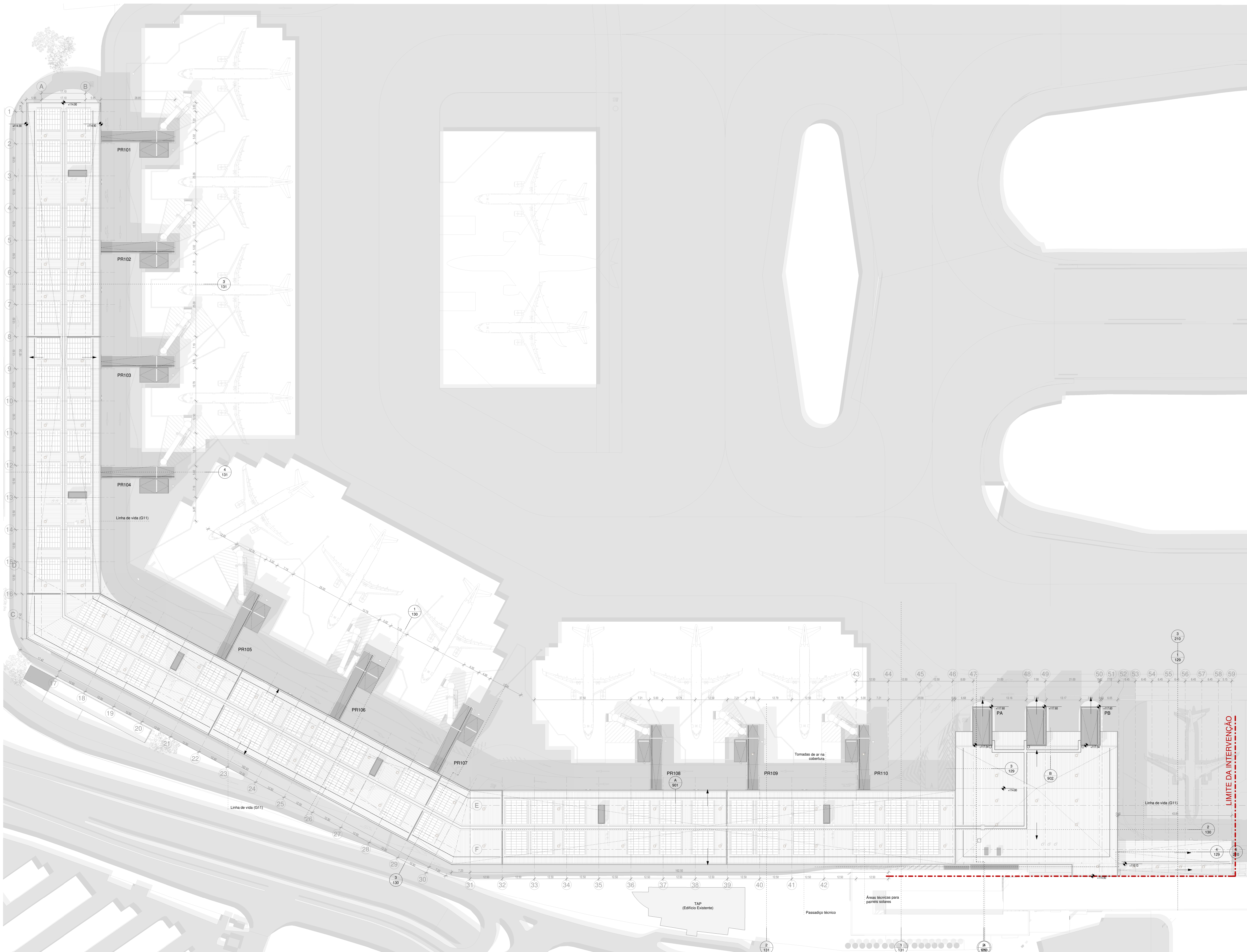
Planta de Cobertura 1 : 500

NOTAS GERAIS - Todas as cotas deverão ser verificadas em obra. - Caso se verifique qualquer incompatibilidade no presente projeto, a mesma deverá de imediato ser comunicada por escrito para o projetista. - Este desenho carece de consulta e análise de outras peças de projeto. - Deverão ser verificadas em obra todas as condicionantes assumidas no projeto. - Todas as Especialidades desenhadas são meramente indicativas, para a sua execução deverão ser consultados os desenhos das respetivas Especialidades. - Não medir desenhos, utilizar apenas a cotaagem. Todas as cotas apresentadas deverão ser aferidas em obra. - Em caso de incongruência entre desenhos no Presente Projeto, a escala mais ampla é a que vigorar, no entanto, a mesma deverá de imediato ser comunicada por escrito para o Projetista. - Todos os acabamentos e materiais deverão ser validados / aprovados em obra pela equipa projetista. CODIFICAÇÃO DE COMPARTIMENTOS Zona do projeto (algarismo) X - YZZ Zona A+B+1 Zona C+2 Zona D+3 Zona E+4 Piso de referência Número de compartimento CODIFICAÇÃO DE VÃOS Caracterização do Tipo "2" Numeração do Tipo Tipologia do Vão "1" Abstrac Numeração do Tipo Zona do projeto Número de eixo Caracterização do tipo "3" Identificação do Piso 1 - Tipologia do Vão: P= Pórtico V= Vãos Janelas 2 - Caracterização do Tipo: E= exterior I= Interior 3 - Caracterização do tipo: ex= exterior in= interior PLANTA CHAVE